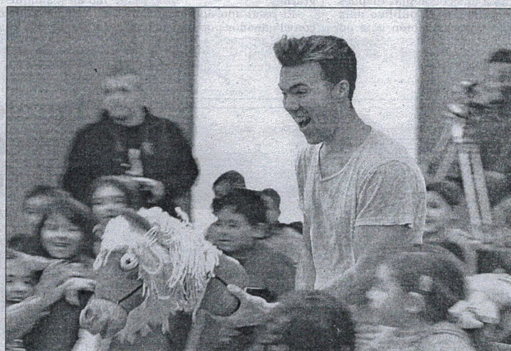
Uno de los momentos del musical.