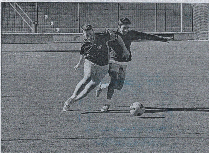
Instante del partido de alumnos contra profesores.