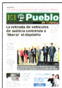
PORTADA DE HOY