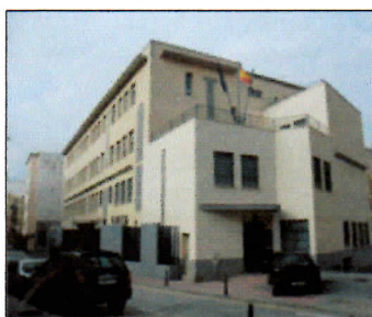
DIRECCION PROVINCIAL DE EDUCACION. EP.