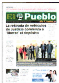
PORTADA DE HOY