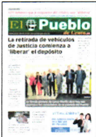
PORTADA DE HOY