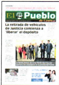
PORTADA DE HOY