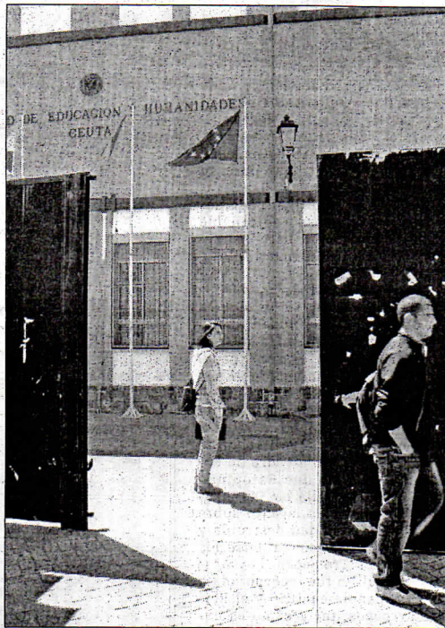
El estudio buscará los hábitos de vida de alumnos de 1º de grado.

La participación en este estudio es voluntaria para los alumnos de cualquier campus, en el caso de Ceuta se dirige a alumnos y alumnas de 1º de Grado de la Facultad de Humanidades y Educación de la UGR.