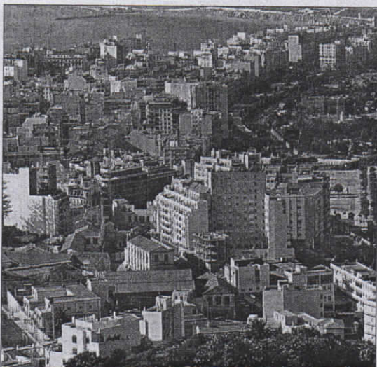
En términos absolutos, Ceuta está a la cola en venta de viviendas.

espacio el próximo abril", indicaron entonces. La reunión sirvió para presentar los pliegos de condiciones para la contratación de la gestión del servicio de residencia de estudiantes, cafetería y copistería, espacios comunes contemplados en el proyecto.