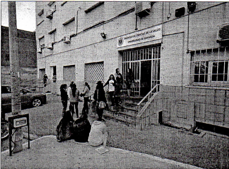
Los profesores de la Facultad de Ciencias de la Salud esperan una resolución de la administración desde hace meses.

que ambas funciones sean compatibles. Para la resolución de este conflicto la UGR propondrá una variación en la retribución económica y un cambio en su categoría.