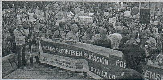
El proyecto de ley pretende acabar con los "duros recortes" de 2012.

El texto incluye, una vez que ha pasado por el Senado aprovechando la mayoría absoluta de los 'populares' en la Cámara alta, que los maestros de Primaria tengan 23 horas lectivas y los profesores de Secundaria 18 en toda España. Según Comisiones Obreras, la jornada lectiva docente en España se sitúa actualmente entre un 6,7% y un 9,73% por encima de la media de la Unión Europea.