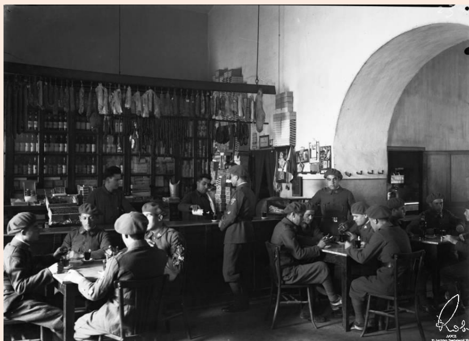
Ceuta. Cuartel de la Reina, luego Teniente Ruiz, sede del Regimiento de Infantería de Ceuta número 60. Cantina (Ros, 1929, Archivo General de Ceuta)