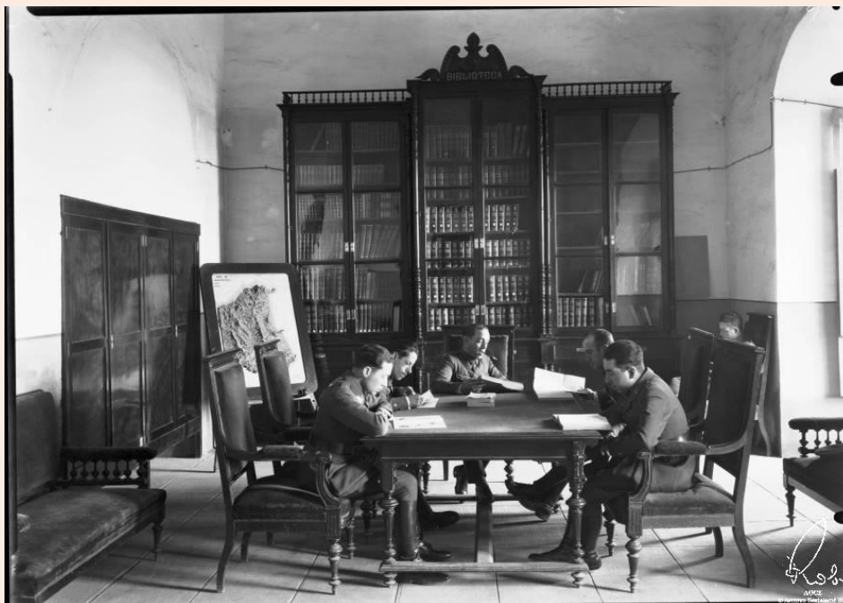
Ceuta. Cuartel de la Reina, luego Teniente Ruiz, sede del Regimiento de Infantería de Ceuta número 60. Biblioteca de oficiales