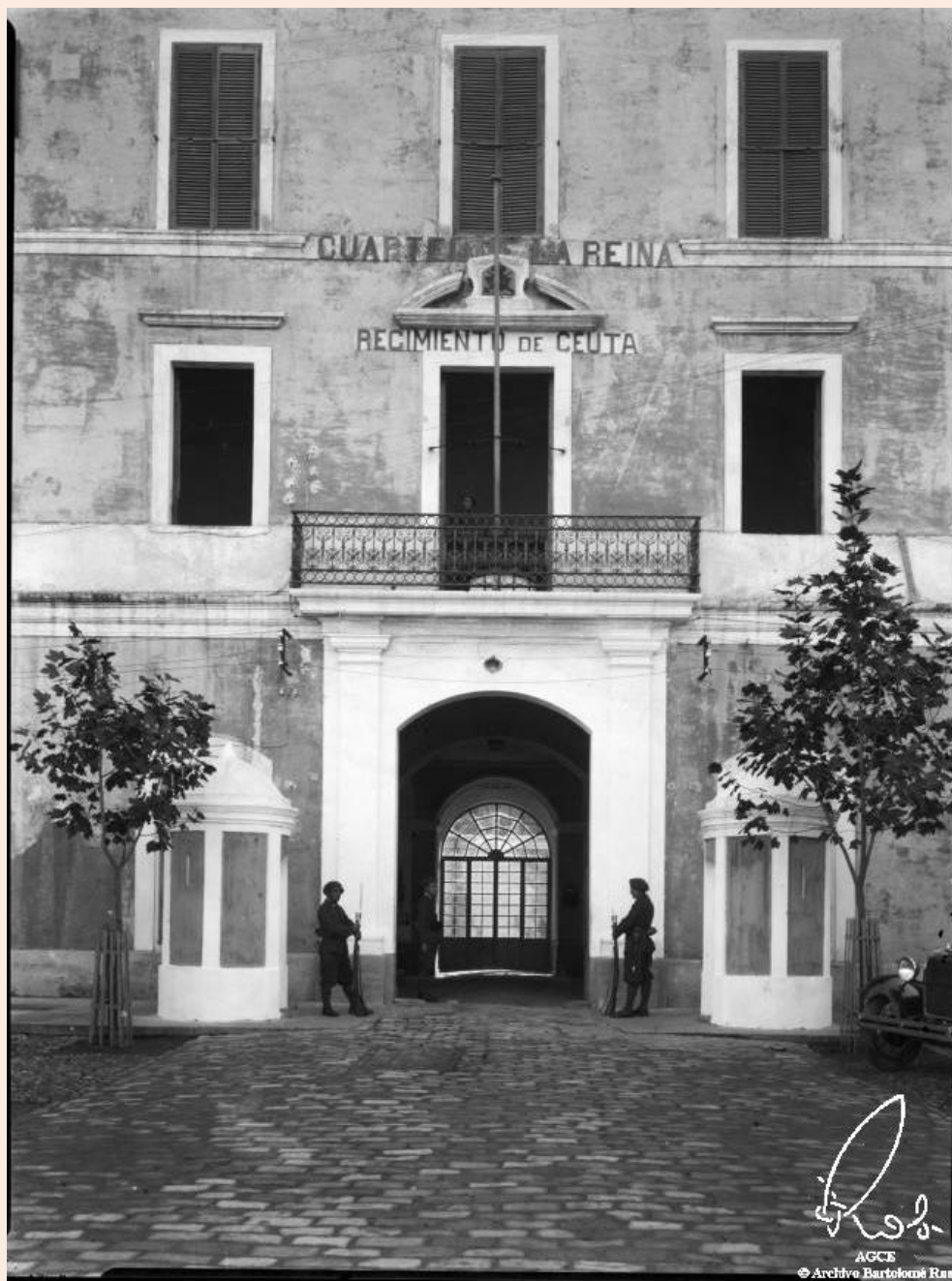
Ceuta. Cuartel de la Reina, luego Teniente Ruiz, sede del Regimiento de Infantería de Ceuta número 60. Fachada principal (Ros, 1929, Archivo General de Ceuta)