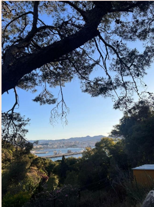
Yusra Idris Mohamed (3º Premio en el Concurso de Fotografía “Santo Tomás de Aquino 2024”)