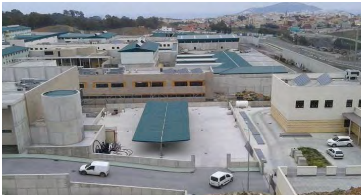
Imagen 1. En esta imagen podemos observar cómo es la estructura de la nueva cárcel situada en Ceuta, conocida como Fuerte Mendizábal.

Estudiantes de 2º Curso en Educación Social