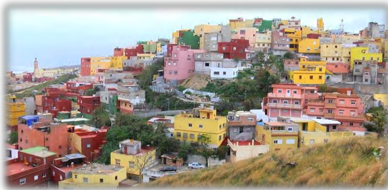
(Foto de la barriada en la que vive Nabil. Fuente: El Faro de Ceuta)

cada noche pensando en lo que le falta a su familia y en las deudas que tienen.