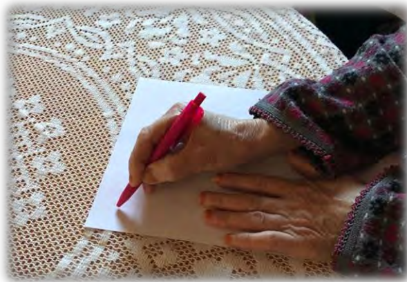
(Fotografía de Erhimo intentando escribir alguna palabra.)

Erhimo es un ejemplo de que para ser feliz no se necesita mucho.