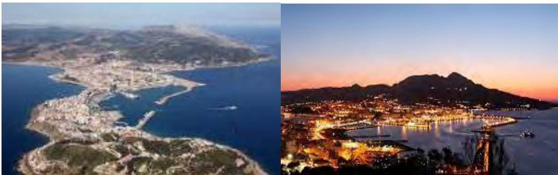
Distintas imágenes de Ceuta.

Es por ello que mediante este artículo procuramos mostrar las dificultades que tiene este colectivo para mantener relaciones entre sus iguales y en la sociedad, así como la perspectiva que tiene la sociedad de ellos. Para ello, en este artículo se muestra el porcentaje de menores que actualmente residen en Ceuta, una conclusión desde el punto de vista de la sociedad, extraída a través de varias entrevistas de diferentes colectivos, una entrevista a un inmigrante que era MENA en Ceuta y una opinión personal a raíz de la información analizada y discutida.