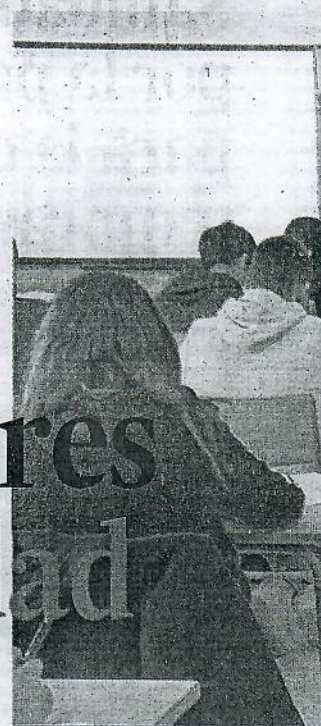
La docencia es una profesión vocacional que